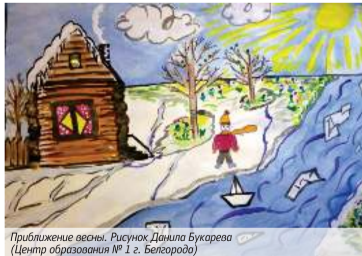
Приближение весны. Рисунок Даниила Букарева (Центр образования № 1 г. Белгорода)