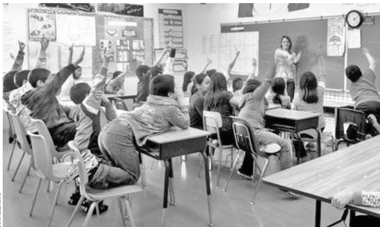
Занятия в одной из канадских школ