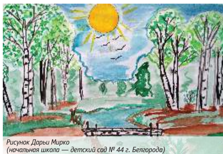
Рисунок Дарьи Мирко (начальная школа — детский сад № 44 г. Белгорода)