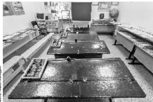
Зал истории образования в музее Томаровской школы № 1

С тех пор все уроки русского языка, литературы и беседы о советском обществе проходили без курьёзов. Молоденькая учительница даже съездила в областное управление кинофикации. Договорилась каждую неделю по пятницам привозить в колонию фильмы.