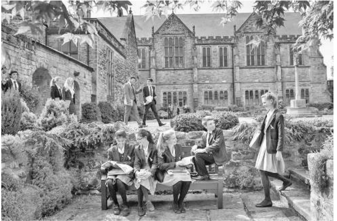
В некоторых канадских школах от формы и не думали отказываться