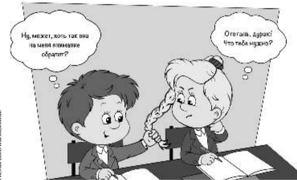
РИСУНОК ЕКАТЕРИНЫ КАСАКИНОЙ

Наши подростки переживают чувства влюблённости, первой любви, дружбы — это прекрасные человеческие чувства и отношения,